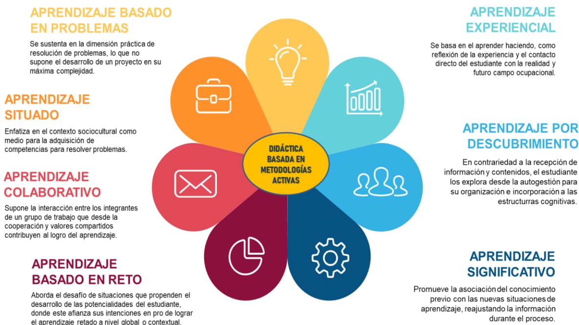
Infograma 4. Fluctuación de enfoques de aprendizaje desde el MOPHTA.

Todo lo anterior, reviste la concreción del hecho didáctico pedagógico con respaldado en diversos enfoques de aprendizajes que guardan estrecha relación con cada una de las teorías que dan lugar al sintagma del modelo emergente. Visto así, se tiene lo siguiente: